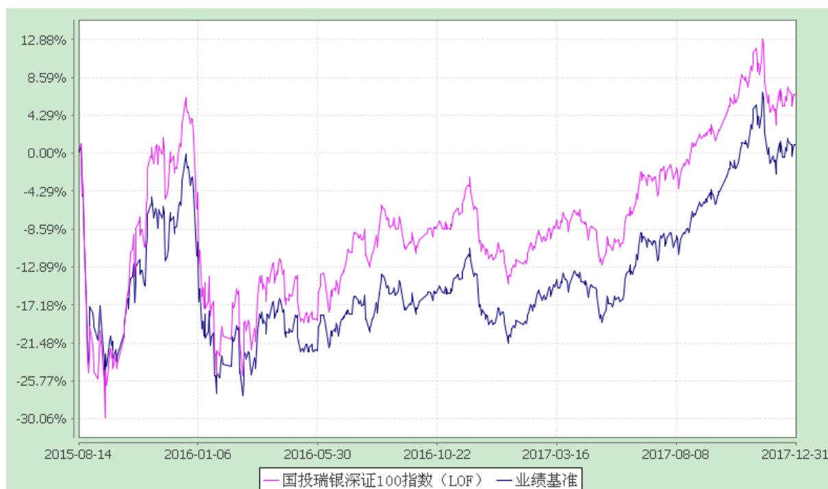
国投瑞银瑞福深证 100 指数证券投资基金（LOF） 份额累计净值增长率与业绩比较基准收益率的历史走势对比图 （2015 年 8 月 14 日至 2017 年 12 月 31 日）

注：截至本报告期末各项资产配置比例分别为股票投资占基金净值比例 93.56%，权证投资占基金净值比例 0%，债券投资占基金净值比例 0%，现金和到期日不超过 1 年的政府债券占基金净值比例 6.79%，符合基金合同的相关规定。