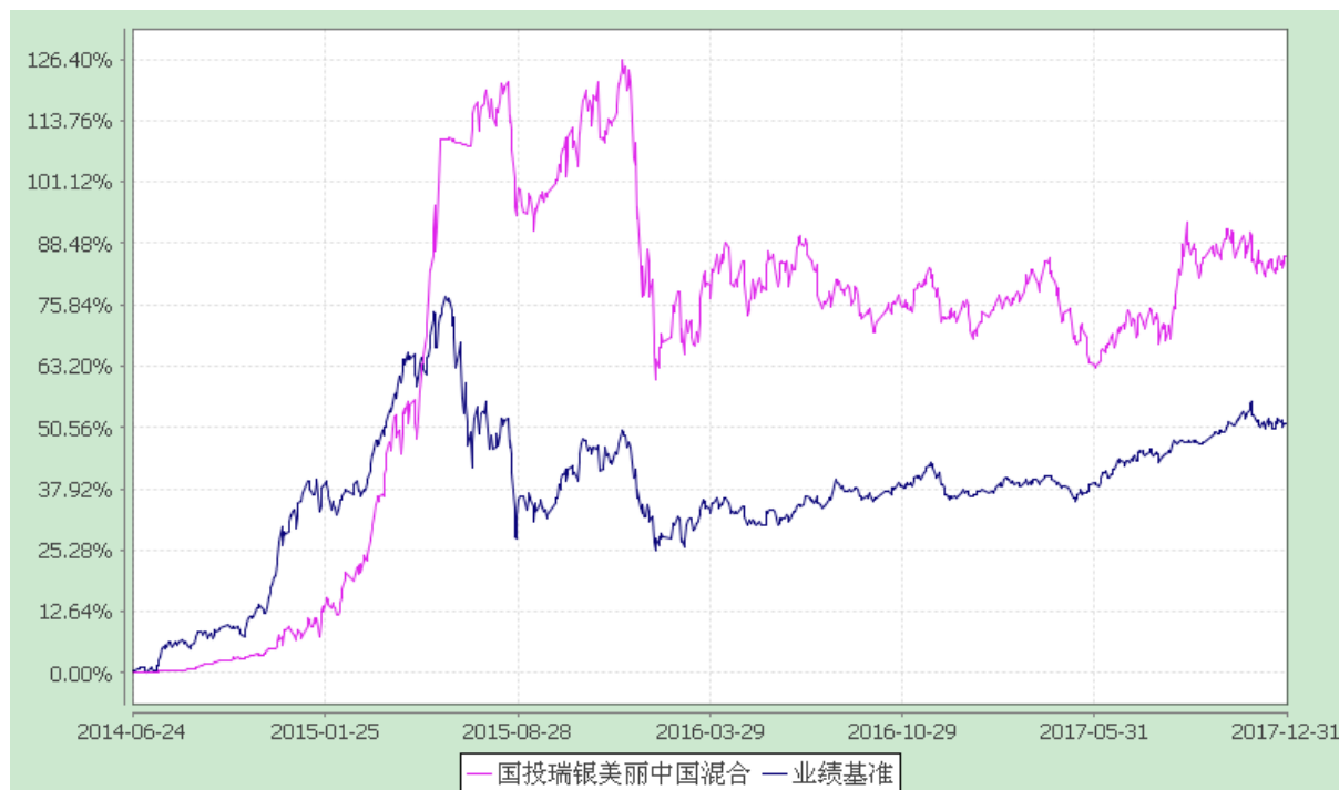
国投瑞银美丽中国灵活配置混合型证券投资基金 份额累计净值增长率与业绩比较基准收益率的历史走势对比图 (2014 年 6 月 24 日至 2017 年 12 月 31 日)