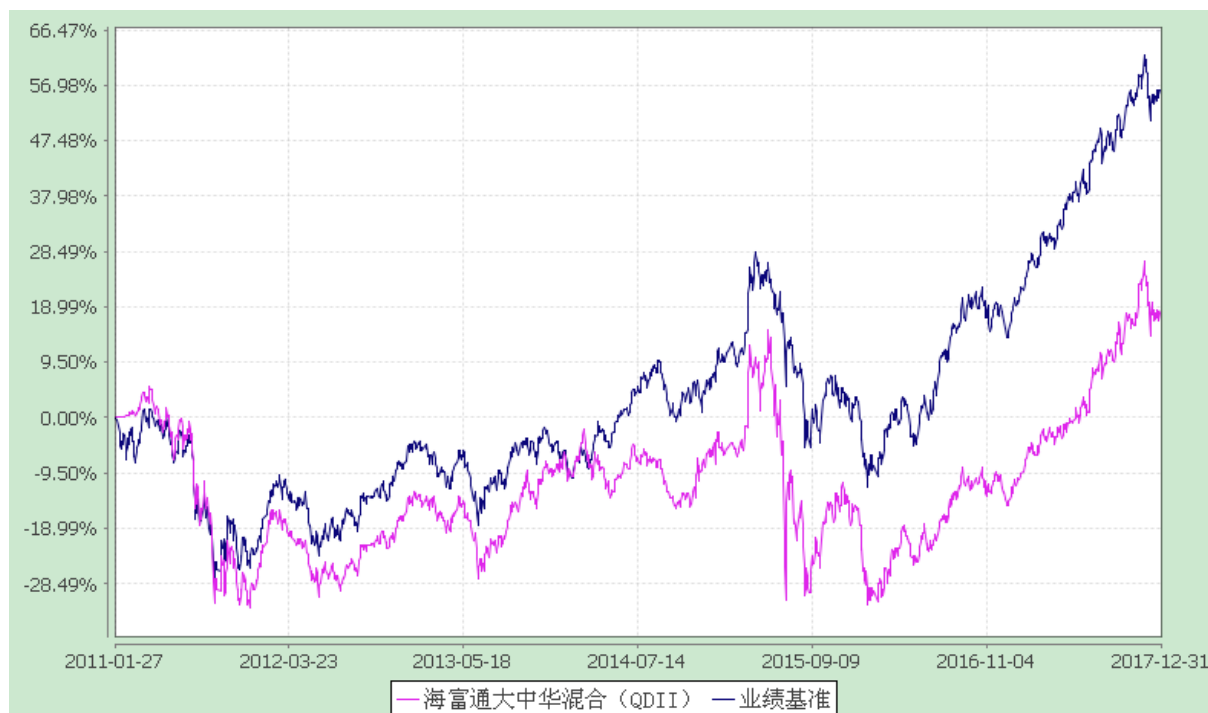
海富通大中华精选混合型证券投资基金 份额累计净值增长率与业绩比较基准收益率历史走势对比图 (2011 年 1 月 27 日至 2017 年 12 月 31 日)

注：1、按照本基金合同规定，本基金建仓期为基金合同生效之日起六个月，截至报告期末本基金的各项投资比例已达到基金合同第十四条（三）投资范围、（九）投资限制中规定的各项比例；