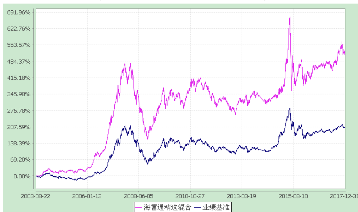
海富通精选证券投资基金 份额累计净值增长率与业绩比较基准收益率的历史走势对比图 (2003 年 8 月 22 日至 2017 年 12 月 31 日)

注：1、按基金合同规定,本基金自基金合同生效起 6 个月内为建仓期。本基金自 2007 年 6 月 28 日至 2007 年 9 月 29 日,为持续营销后建仓期。建仓期满至今,本基金投资组合均达到本基金合同第十八条(三)、(六)规定的比例限制及本基金投资组合的比例