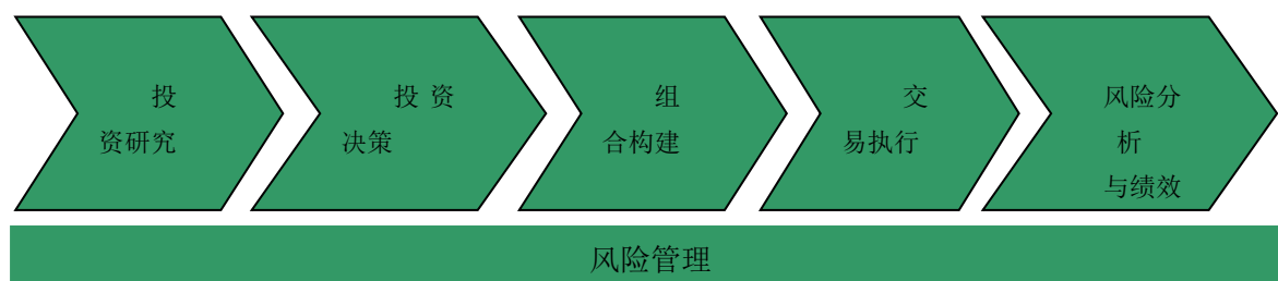
图 1-2 投资管理流程

本基金管理人建立了规范的投资管理流程和严格的风险管理体系，贯彻于投资研究、投资决策、组合构建、交易执行、风险管理及绩效评估的全过程。