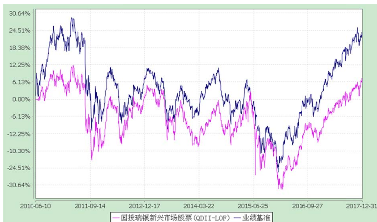
国投瑞银全球新兴市场精选股票型证券投资基金（LOF） 份额累计净值增长率与业绩比较基准收益率历史走势对比图 (2010年6月10日至2017年12月31日)

注：本基金建仓期为自基金合同生效日起的6个月。截至建仓期结束，本基金各项资产配置比例符合基金合同及招募说明书有关投资比例的约定。