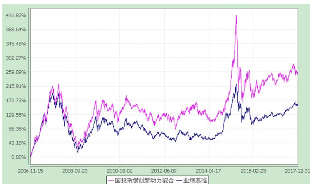
国投瑞银创新动力混合型证券投资基金 份额累计净值增长率与业绩比较基准收益率的历史走势对比图 (2006 年 11 月 15 日至 2017 年 12 月 31 日)

注：本基金建仓期为自基金合同生效日起的六个月。截至建仓期结束，本基金各项资产配置比例符合基金合同及招募说明书有关投资比例的约定。