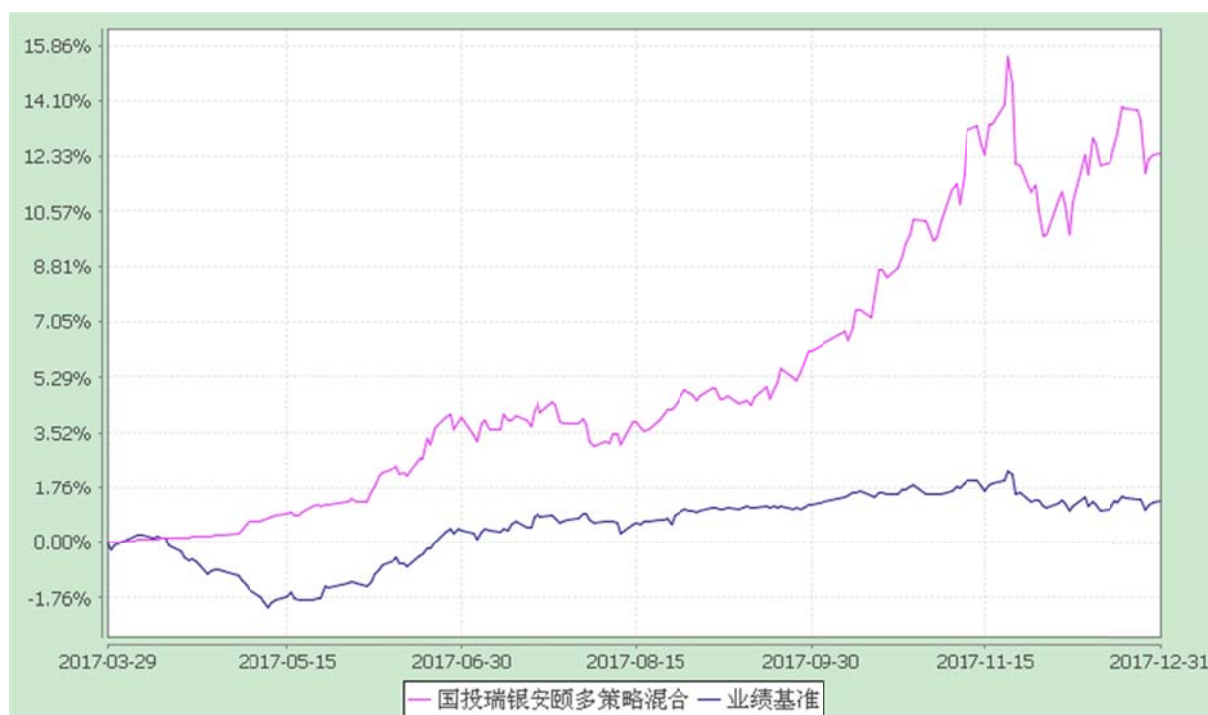
国投瑞银安颐多策略混合型证券投资基金 份额累计净值增长率与业绩比较基准收益率的历史走势对比图 (2017 年 3 月 29 日至 2017 年 12 月 31 日)

注：1、本基金建仓期为自基金合同生效日起的 6 个月。截至建仓期结束，本基金各项资产配置比例符合基金合同及招募说明书有关投资比例的约定。