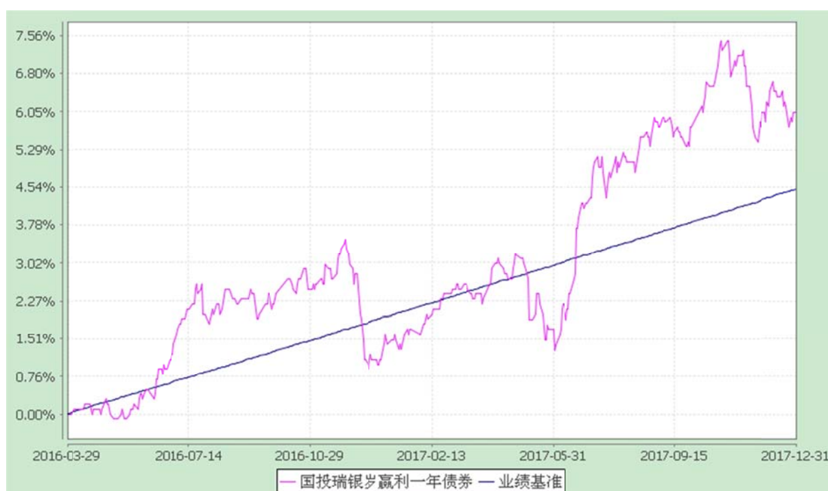
国投瑞银岁赢利一年期定期开放债券型证券投资基金 份额累计净值增长率与业绩比较基准收益率的历史走势对比图 (2016年3月29日至2017年12月31日)

注：本基金建仓期为自基金合同生效日起的六个月。截至建仓期结束，本基金各项资产配置比例符合基金合同及招募说明书有关投资比例的约定。