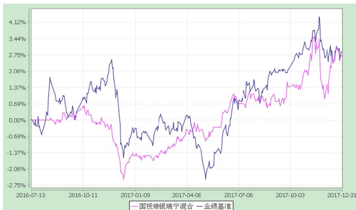
国投瑞银瑞宁灵活配置混合型证券投资基金 份额累计净值增长率与业绩比较基准收益率的历史走势对比图 (2016 年 7 月 13 日至 2017 年 12 月 31 日)

注：本基金建仓期为自基金合同生效日起的 6 个月。截至建仓期结束，本基金各项资产配置比例符合基金合同及招募说明书有关投资比例的约定。