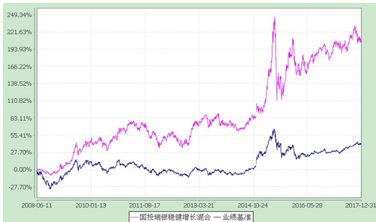
国投瑞银稳健增长灵活配置混合型证券投资基金 份额累计净值增长率与业绩比较基准收益率的历史走势对比图 (2008 年 6 月 11 日至 2017 年 12 月 31 日)