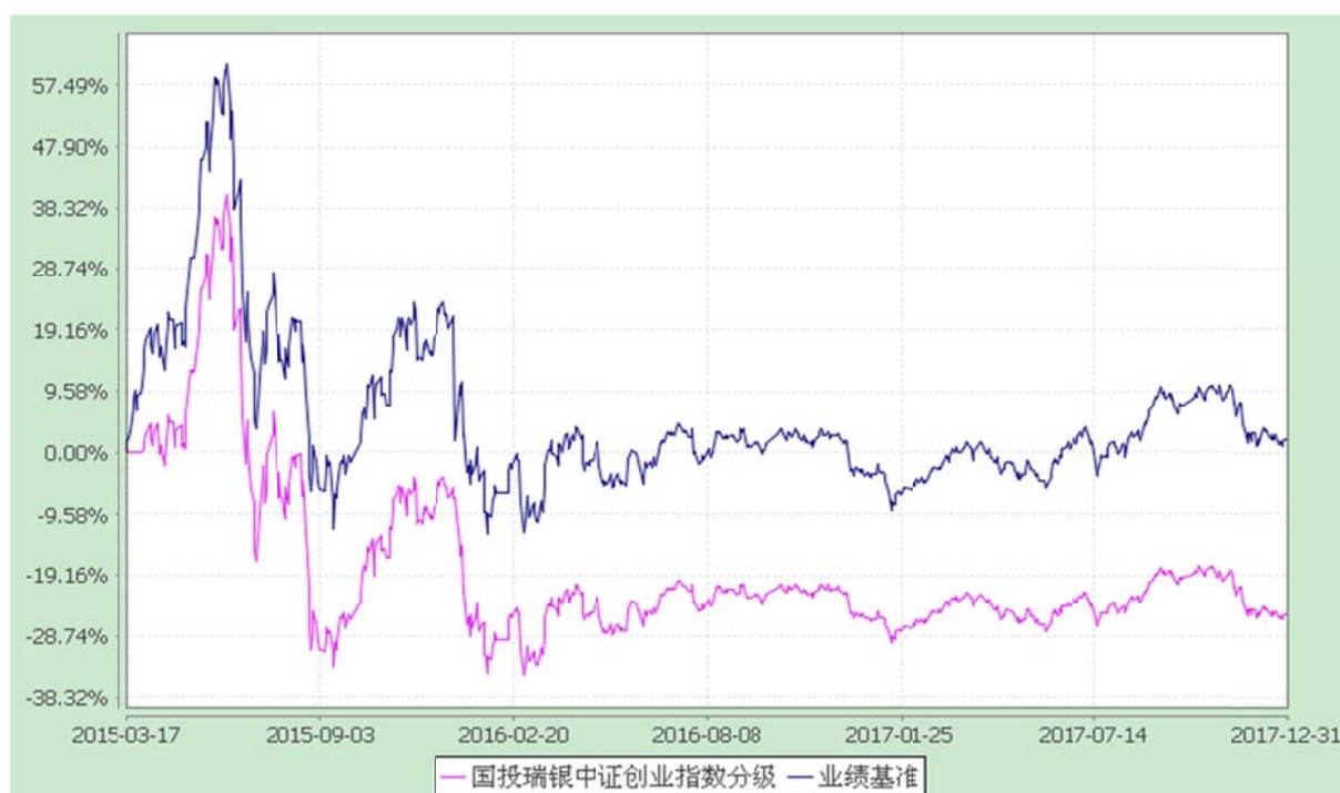
国投瑞银瑞泽中证创业成长指数分级证券投资基金 份额累计净值增长率与业绩比较基准收益率的历史走势对比图 (2015 年 3 月 17 日至 2017 年 12 月 31 日)

注：本基金建仓期为自基金合同生效日起的 6 个月。截至建仓期结束，本基金各项资产配置比例符合基金合同及招募说明书有关投资比例的约定。