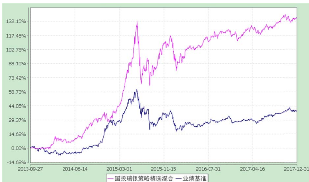
国投瑞银策略精选灵活配置混合型证券投资基金 份额累计净值增长率与业绩比较基准收益率的历史走势对比图 (2013 年 9 月 27 日至 2017 年 12 月 31 日)

注：本基金建仓期为自基金合同生效日起的 6 个月。截至建仓期结束，本基金各项资产配置比例符合基金合同及招募说明书有关投资比例的约定。