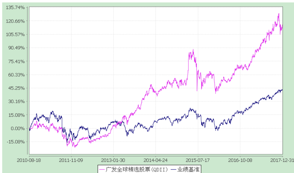
广发全球精选股票型证券投资基金 份额累计净值增长率与业绩比较基准收益率历史走势对比图 (2010 年 8 月 18 日至 2017 年 12 月 31 日)

注：本基金自 2014 年 6 月 10 日起，将基金业绩比较基准由“摩根士丹利综合亚太（除日本）总收益指数”变更为“60%×MSCI 全球指数（MSCI World Index）+40%×恒生指数”。