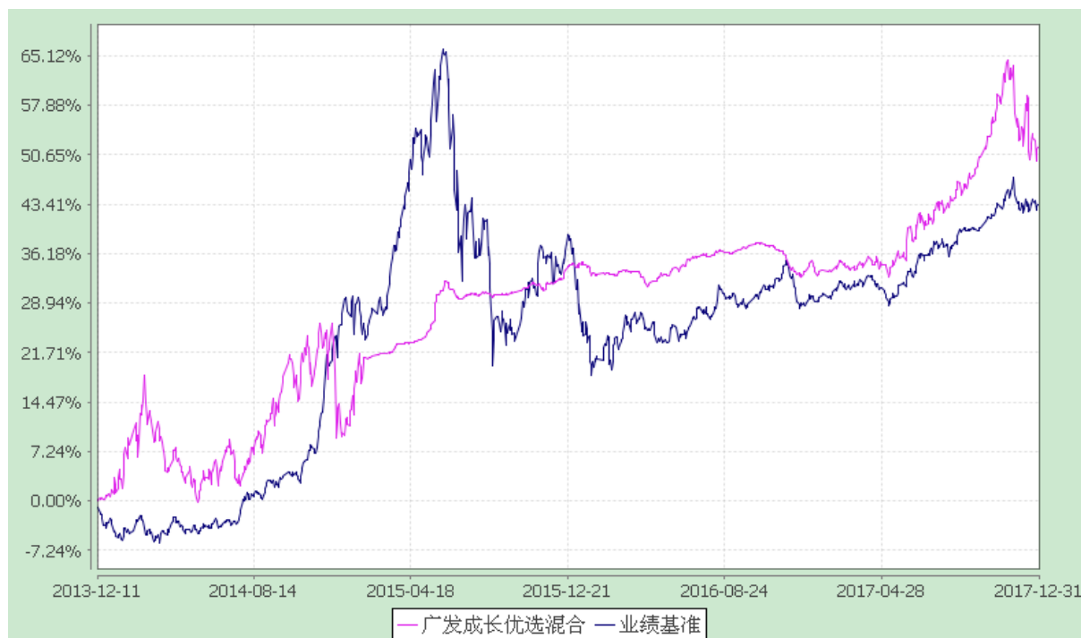
广发成长优选灵活配置混合型证券投资基金 份额累计净值增长率与业绩比较基准收益率的历史走势对比图 (2013 年 12 月 11 日至 2017 年 12 月 31 日)