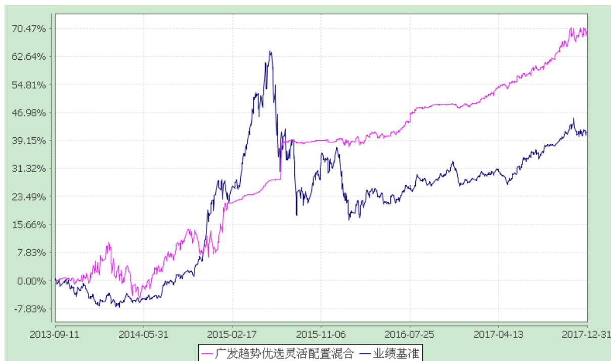
广发趋势优选灵活配置混合型证券投资基金 份额累计净值增长率与业绩比较基准收益率的历史走势对比图 (2013 年 9 月 11 日至 2017 年 12 月 31 日)