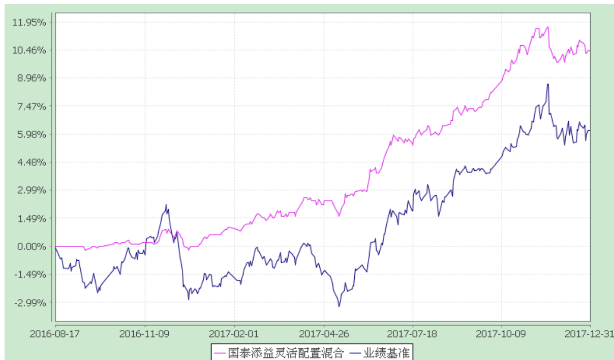
自基金合同生效以来份额累计净值增长率与业绩比较基准收益率的历史走势对比图 (2016 年 8 月 17 日至 2017 年 12 月 31 日)

注：本基金合同生效日为 2016 年 8 月 17 日。本基金在六个月建仓期结束时，各项资产配置比例符合合同约定。