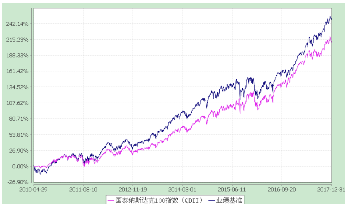
国泰纳斯达克 100 指数证券投资基金 自基金合同生效以来份额累计净值增长率与业绩比较基准收益率历史走势对比图 (2010 年 4 月 29 日至 2017 年 12 月 31 日)

注：（1）本基金合同生效日为 2010 年 4 月 29 日。本基金在六个月建仓期结束时，各项资产配置比例符合合同约定；