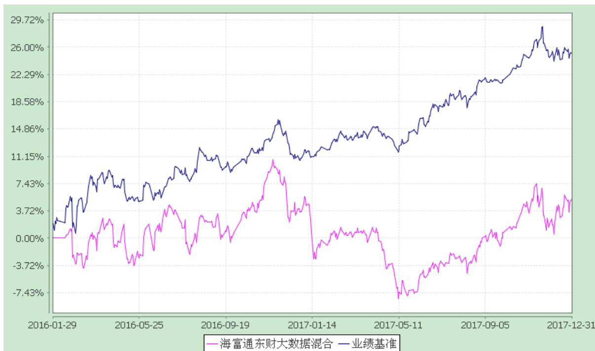
海富通东财大数据灵活配置混合型证券投资基金 份额累计净值增长率与业绩比较基准收益率的历史走势对比图 (2016 年 1 月 29 日至 2017 年 12 月 31 日)

注：本基金合同于 2016 年 1 月 29 日生效，建仓期结束时本基金的各项投资比例已达到基金合同第十二部分（二）投资范围、（四）投资限制中规定的各项比例。