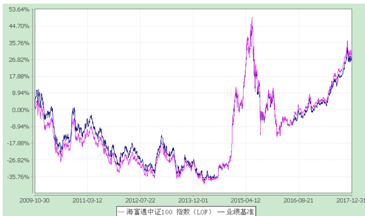
海富通中证 100 指数证券投资基金 (LOF) 份额累计净值增长率与业绩比较基准收益率的历史走势对比图 (2009 年 10 月 30 日至 2017 年 12 月 31 日)

注：按照本基金合同规定，本基金建仓期为基金合同生效之日起六个月。建仓期满至今，本基金投资组合均达到本基金合同第十五条（二）、（七）规定的比例限制及本基金投资组合的比例范围。