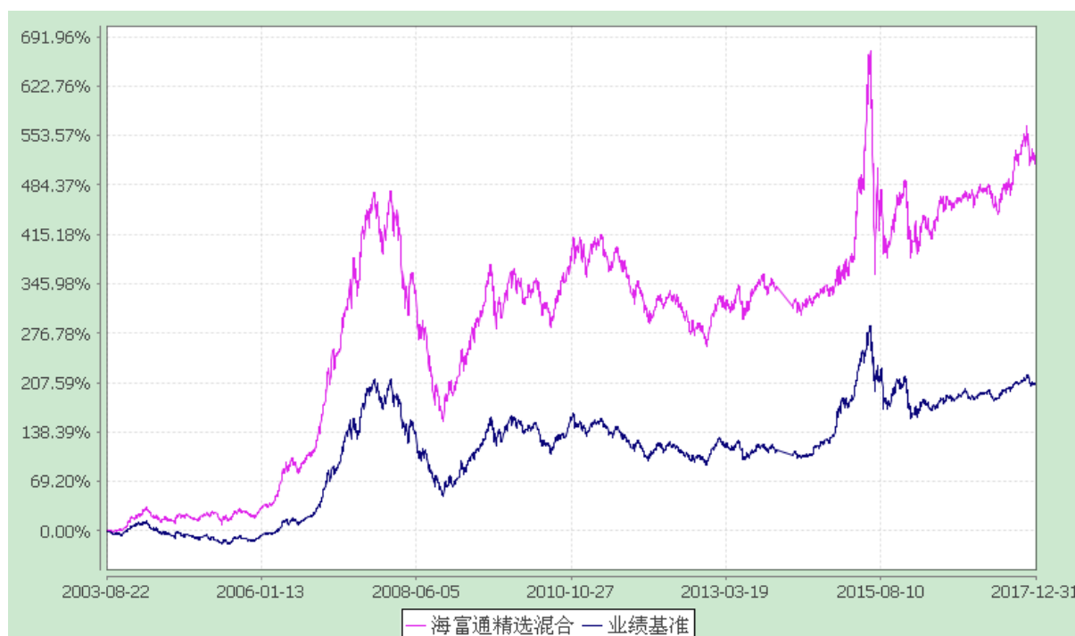
海富通精选证券投资基金 份额累计净值增长率与业绩比较基准收益率的历史走势对比图 (2003 年 8 月 22 日至 2017 年 12 月 31 日)

注：1、按基金合同规定,本基金自基金合同生效起 6 个月内为建仓期。本基金自 2007 年 6 月 28 日至 2007 年 9 月 29 日,为持续营销后建仓期。建仓期满至今,本基金投资组合均达到本基金合同第十八条(三)、(六)规定的比例限制及本基金投资组合的比例范围。 2、为了能更公允地体现基金投资业绩,海富通基金管理有限公司自 2007 年 1 月 1 日起调整海富通精选基金业绩比较基准中股票部分的基准。原比较基准中的上证指数将调整为 MSCI China A 指数,相应的基准权重不变。