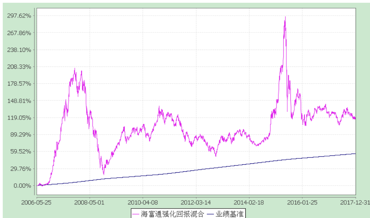
海富通强化回报混合型证券投资基金 份额累计净值增长率与业绩比较基准收益率的历史走势对比图 (2006年5月25日至2017年12月31日)

注：按照本基金合同规定,本基金建仓期为基金合同生效之日起六个月。建仓期满至今,本基金投资组合均达到本基金合同第十二条(二)、(七)规定的比例限制及本基金投资组合的比例范围。