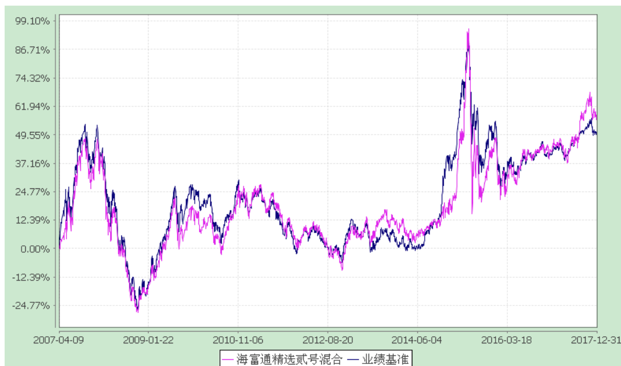
海富通精选贰号混合型证券投资基金 份额累计净值增长率与业绩比较基准收益率的历史走势对比图 (2007 年 4 月 9 日至 2017 年 12 月 31 日)

注：按基金合同规定,本基金自基金合同生效起 6 个月内为建仓期,建仓期满至今本基金的各项投资比例已达到基金合同有关投资范围的规定,即股票投资 50%-80%,债券投资 20%-50%,权证投资 0-3%;并保持不低于基金资产净值 5%的现金或者到期日在一年以内的政府债券。同时满足第 14 章(七)有关投资组合限制的各项比例要求。