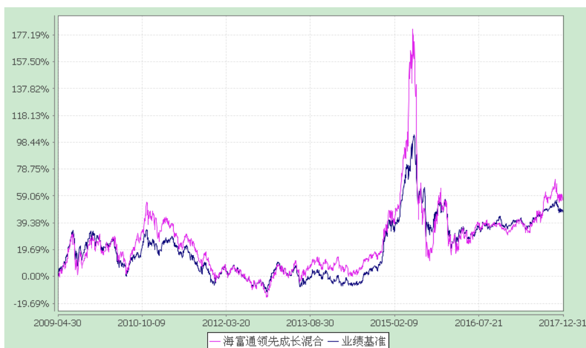
海富通领先成长混合型证券投资基金 份额累计净值增长率与业绩比较基准收益率的历史走势对比图 (2009 年 4 月 30 日至 2017 年 12 月 31 日)

注：按照基金合同规定，本基金建仓期为基金合同生效之日起六个月，即 2009 年 4 月 30 日至 2009 年 10 月 29 日。建仓期结束时本基金投资组合均达到本基金合同第十二条（二）、（七）规定的比例限制及本基金投资组合的比例范围。