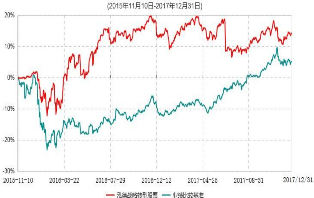
泓德战略转型股票型证券投资基金累计净值增长率与业绩比较基准收益率历史走势对比图