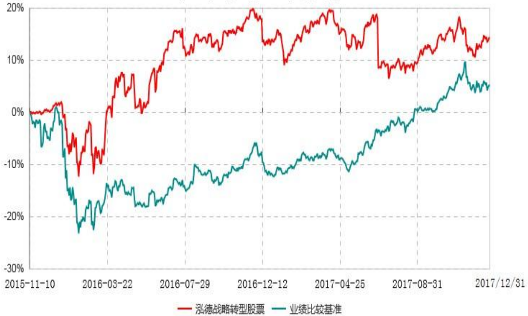
泓德战略转型股票型证券投资基金累计净值增长率与业绩比较基准收益率历史走势对比图 (2015年11月10日-2017年12月31日)

注：本基金建仓期为自基金合同生效日起的6个月。截至报告日，本基金各项资产配置比例符合基金合同及招募说明书有关投资比例的约定。