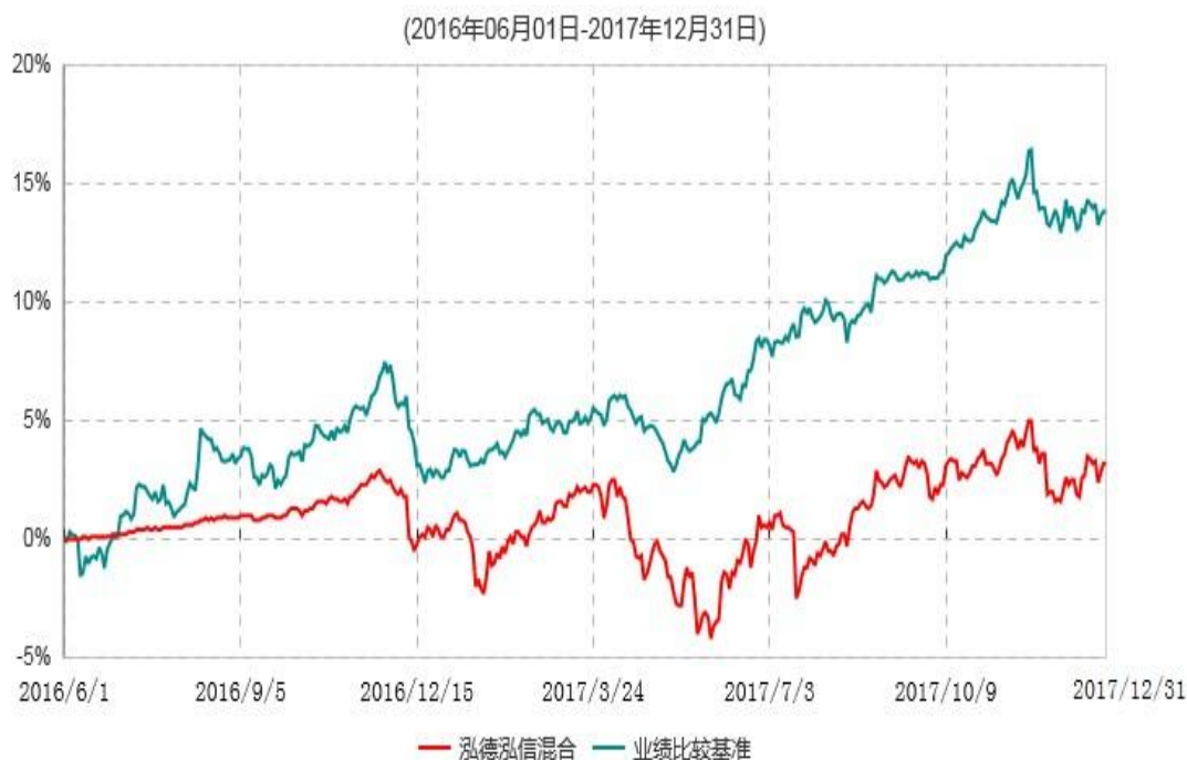
泓德泓信灵活配置混合型证券投资基金累计净值增长率与业绩比较基准收益率历史走势对比图

注：根据基金合同的约定，本基金建仓期为6个月，截止报告日，本基金的各项投资比例符合基金合同关于投资范围及投资限制规定。