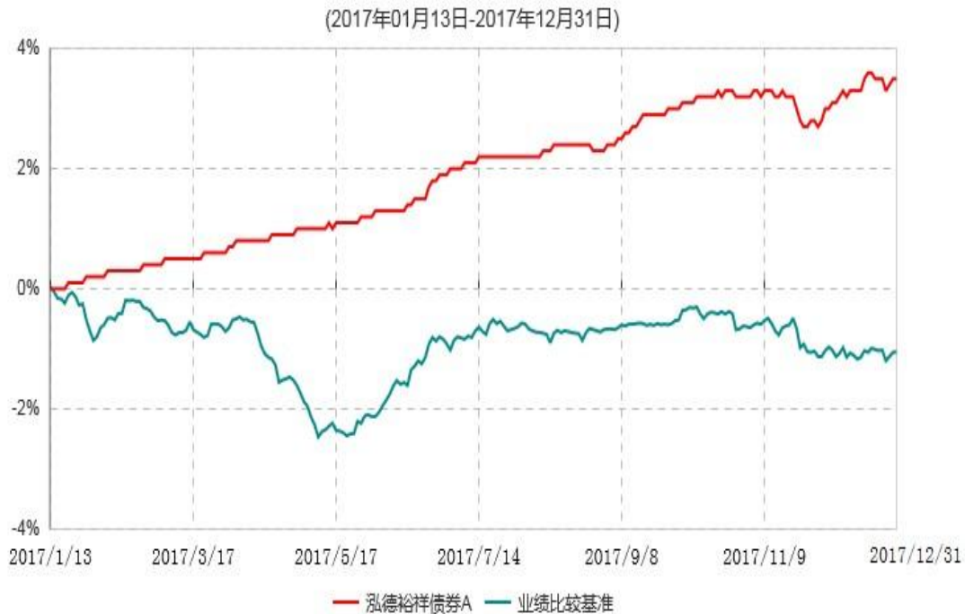
泓德裕祥债券A累计净值增长率与业绩比较基准收益率历史走势对比图