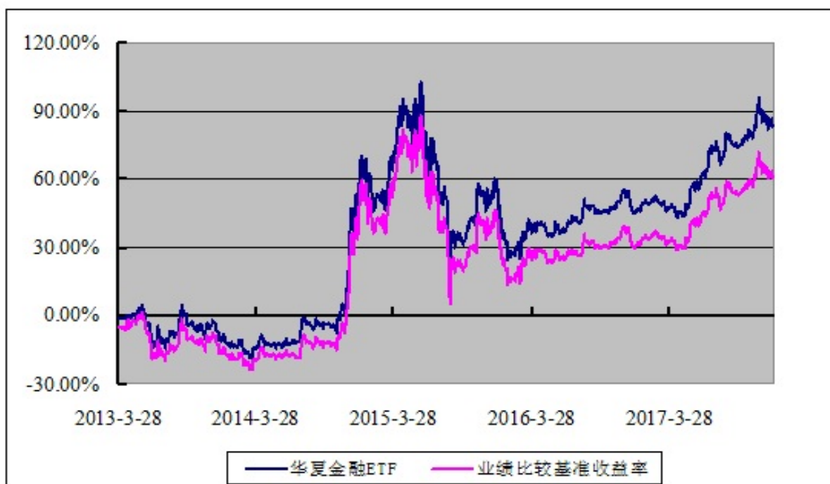
份额累计净值增长率与业绩比较基准收益率的历史走势对比图 (2013 年 3 月 28 日至 2017 年 12 月 31 日)