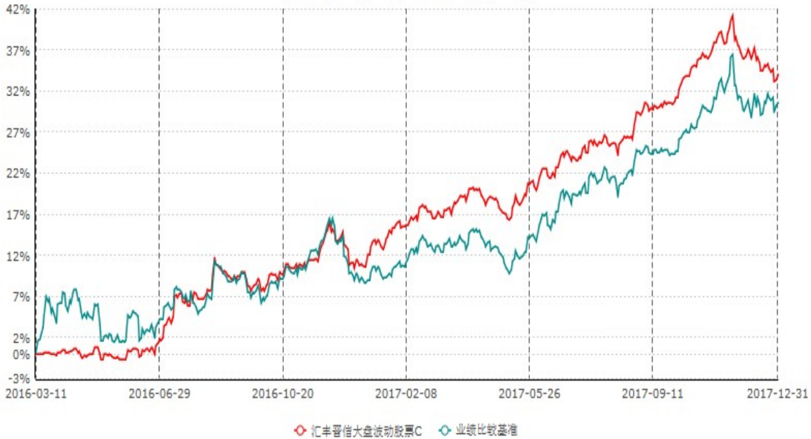
汇丰晋信大盘波动股票C累计净值增长率与业绩比较基准收益率历史走势对比图 (2016年03月11日-2017年12月31日)