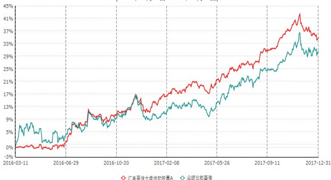
汇丰晋信大盘波动股票A累计净值增长率与业绩比较基准收益率历史走势对比图 (2016年03月11日-2017年12月31日)