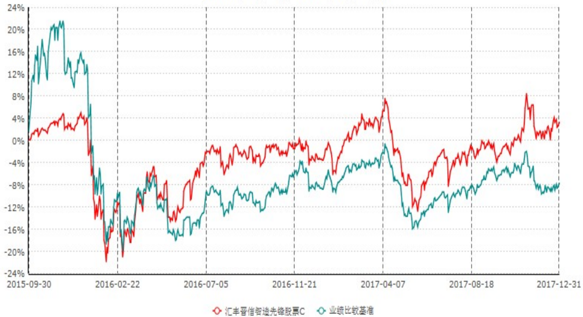
汇丰晋信智造先锋股票C累计净值增长率与业绩比较基准收益率历史走势对比图 (2015年09月30日-2017年12月31日)