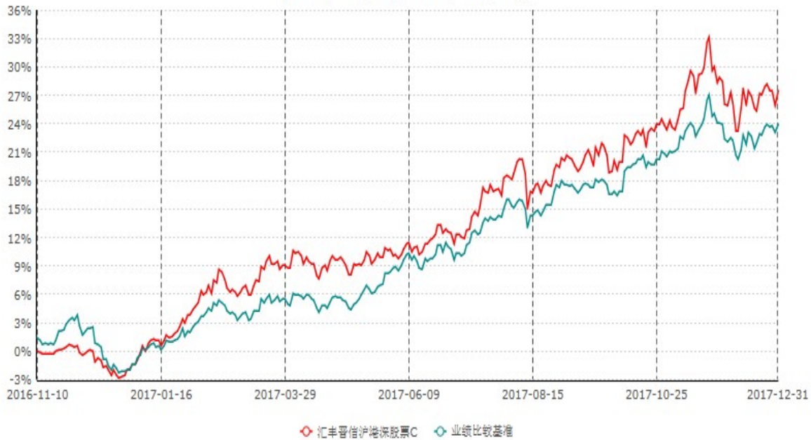
汇丰晋信沪港深股票C累计净值增长率与业绩比较基准收益率历史走势对比图 (2016年11月10日-2017年12月31日)

注：1. 按照基金合同的约定，本基金的投资组合比例为：基金的投资组合比例为：股票资产占基金资产的 80%–95%（投资于港股通标的股票的比例占基金资产的 0–95%），投资于权证的比例为基金资产净值的 0–3%，现金或者到期日在一年以内的政府债券不低于基金资产净值 5%。本基金依据法律法规的规定，本着谨慎和风险可控的原则，可参与创业板上市证券的投资。