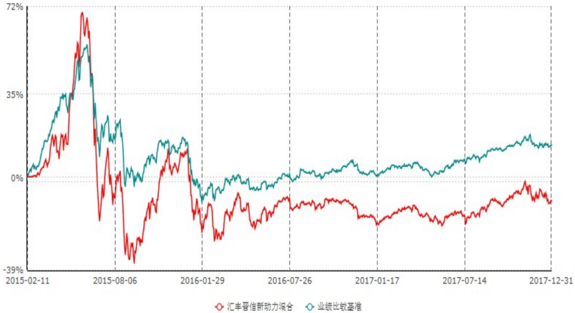
汇丰晋信新动力混合型证券投资基金累计净值增长率与业绩比较基准收益率历史走势对比图 (2015年02月11日-2017年12月31日)