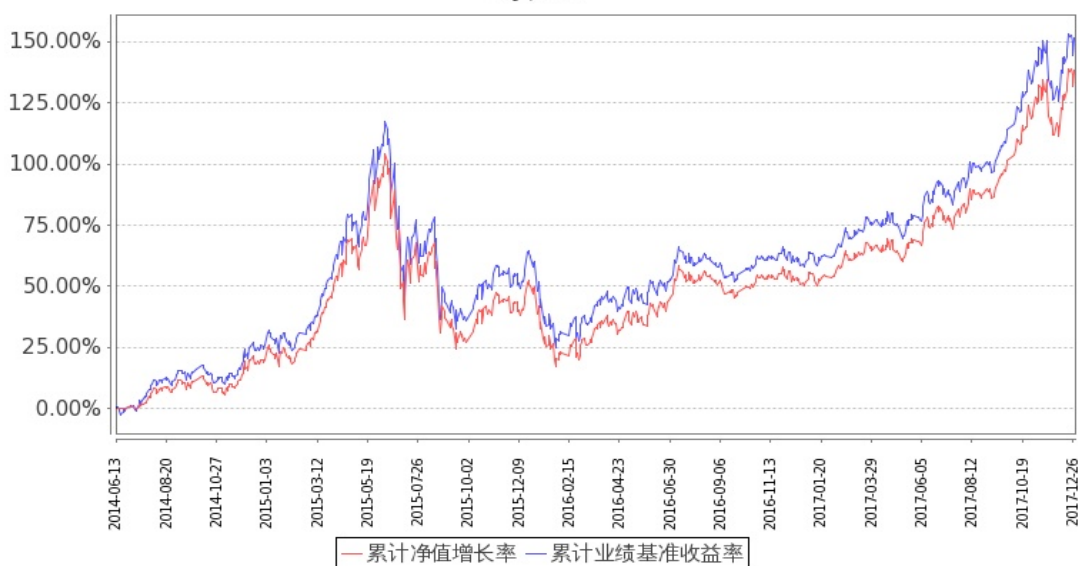
图：嘉实中证主要消费 ETF 基金份额累计净值增长率与同期业绩比较基准收益率的历史走势对比图