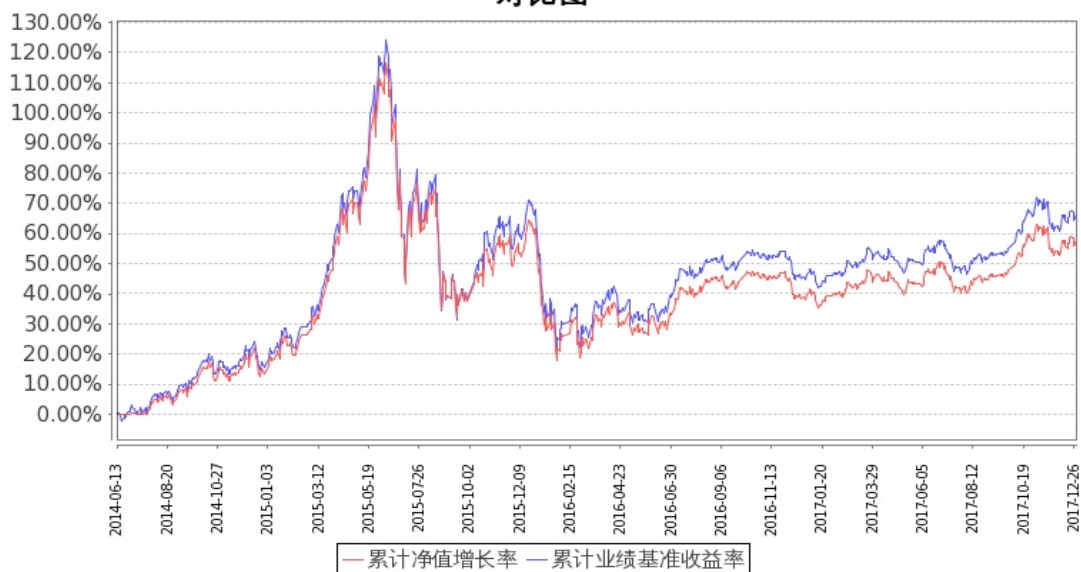
图：嘉实中证医药卫生ETF基金份额累计净值增长率与同期业绩比较基准收益率的历史走势对比图