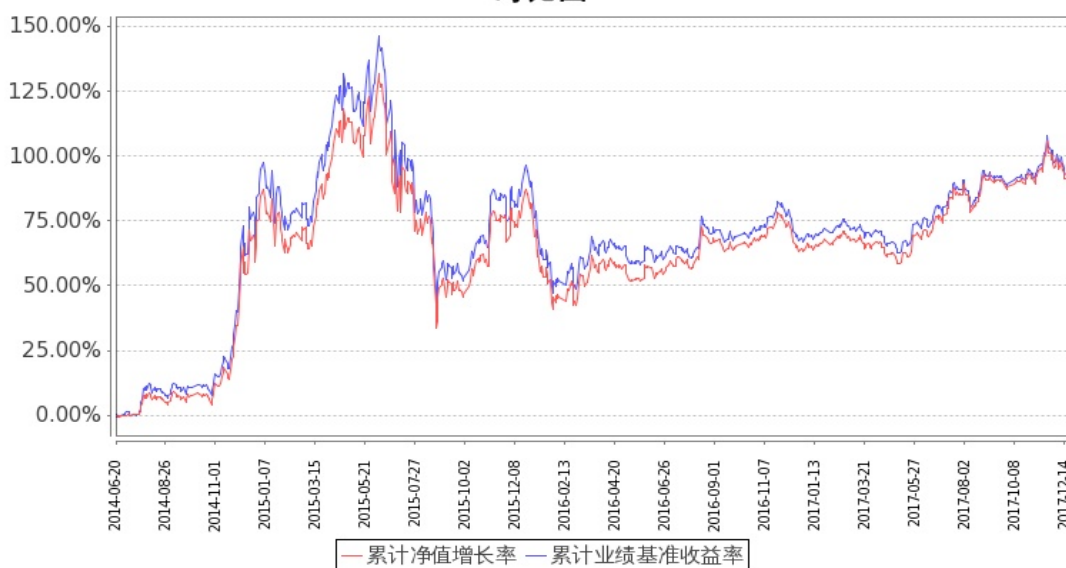
图：嘉实中证金融地产 ETF 基金份额累计净值增长率与同期业绩比较基准收益率的历史走势对比图