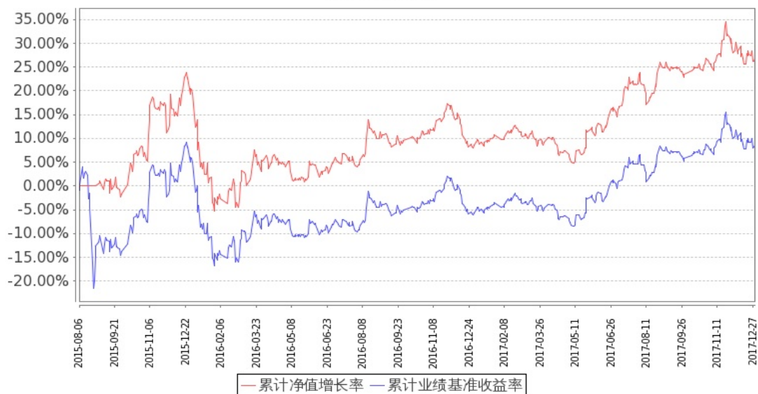
图：嘉实中证金融地产 ETF 联接基金份额累计净值增长率与同期业绩比较基准收益率的历史走势对比图