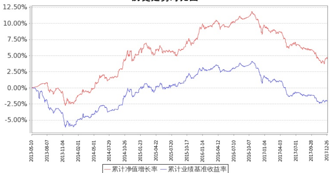
图 1：嘉实中证金边中期国债 ETF 联接 A 基金份额累计净值增长率与同期业绩比较基准收益率的历史走势对比图