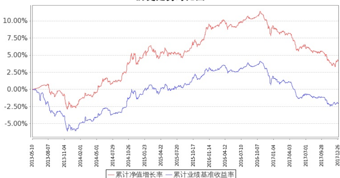
图 2：嘉实中证金边中期国债 ETF 联接 C 基金份额累计净值增长率与同期业绩比较基准收益率的历史走势对比图