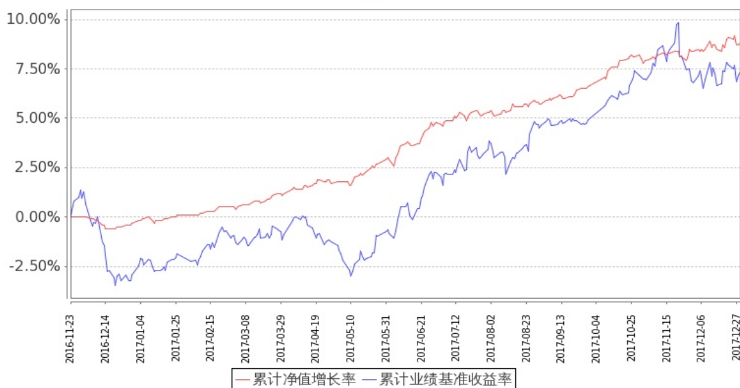
图：嘉实主题增强混合基金份额累计净值增长率与同期业绩比较基准收益率的历史走势对比图