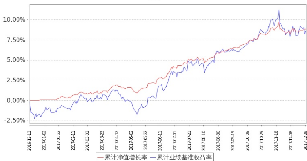
图：嘉实价值增强混合基金份额累计净值增长率与同期业绩比较基准收益率的历史走势对比图 (2016 年 12 月 13 日至 2017 年 12 月 31 日)

注：按基金合同和招募说明书的约定，本基金自基金合同生效日起 6 个月内为建仓期，建仓期结束时本基金的各项投资比例符合基金合同（十二（二）投资范围和（四）投资限制）的有关约定。