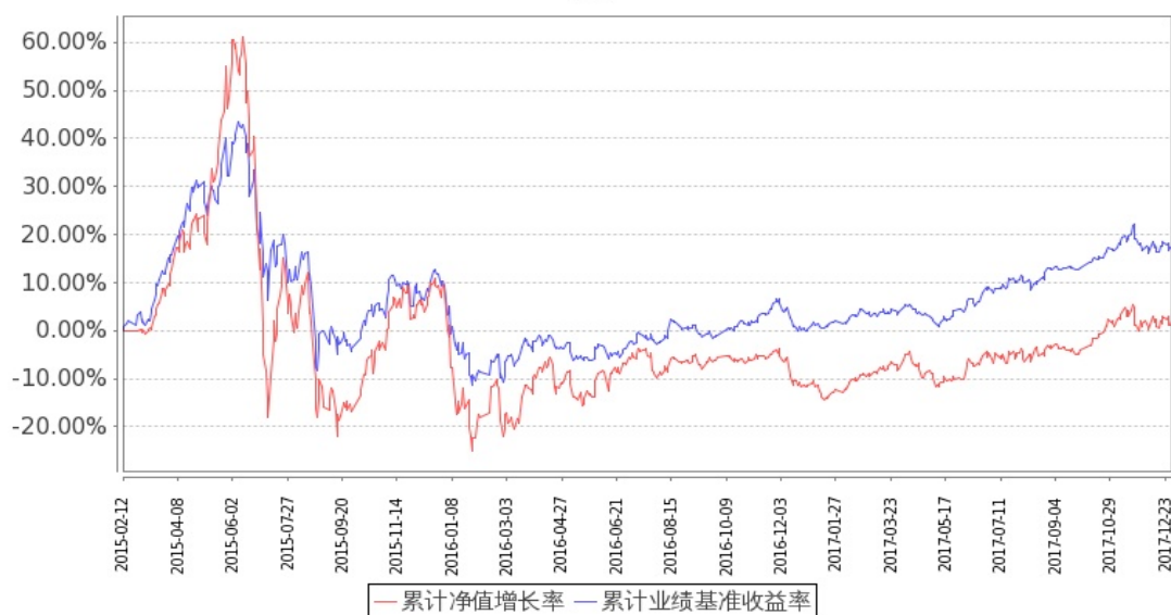
图：嘉实企业变革股票基金份额累计净值增长率与同期业绩比较基准收益率的历史走势对比图 (2015年2月12日至2017年12月31日)

注：1. 按基金合同和招募说明书的约定，本基金自基金合同生效日起6个月内为建仓期，建仓期结束时本基金的各项投资比例符合基金合同（十二（二）投资范围和（四）投资限制）的有关约定。