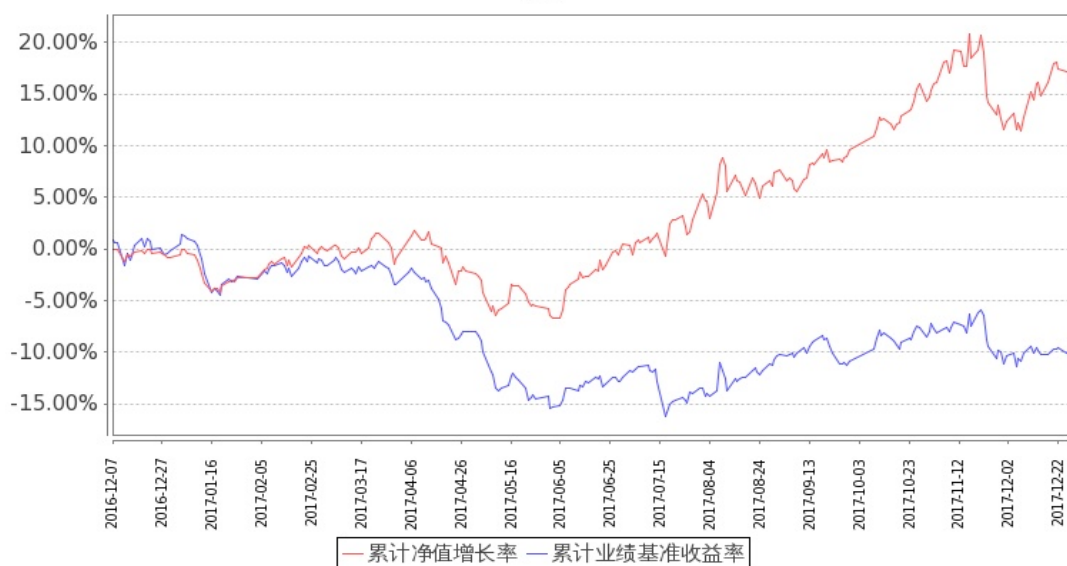
图：嘉实农业产业股票基金份额累计净值增长率与同期业绩比较基准收益率的历史走势对比图 (2016 年 12 月 7 日至 2017 年 12 月 31 日)

注：按基金合同和招募说明书的约定，本基金自基金合同生效日起 6 个月内为建仓期，建仓期结束时本基金的各项投资比例符合基金合同（十二（二）投资范围和（四）投资限制）的有关约定。