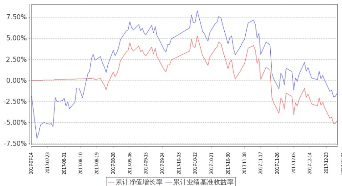
图：嘉实创业板 ETF 基金份额累计净值增长率与同期业绩比较基准收益率的历史走势对比图 (2017 年 7 月 14 日至 2017 年 12 月 31 日)

注：1. 本基金基金合同生效日 2017 年 7 月 14 日至报告期末未满 1 年。按基金合同和招募说明书的约定，本基金自基金合同生效日起 6 个月内为建仓期，本报告期处于建仓期内。