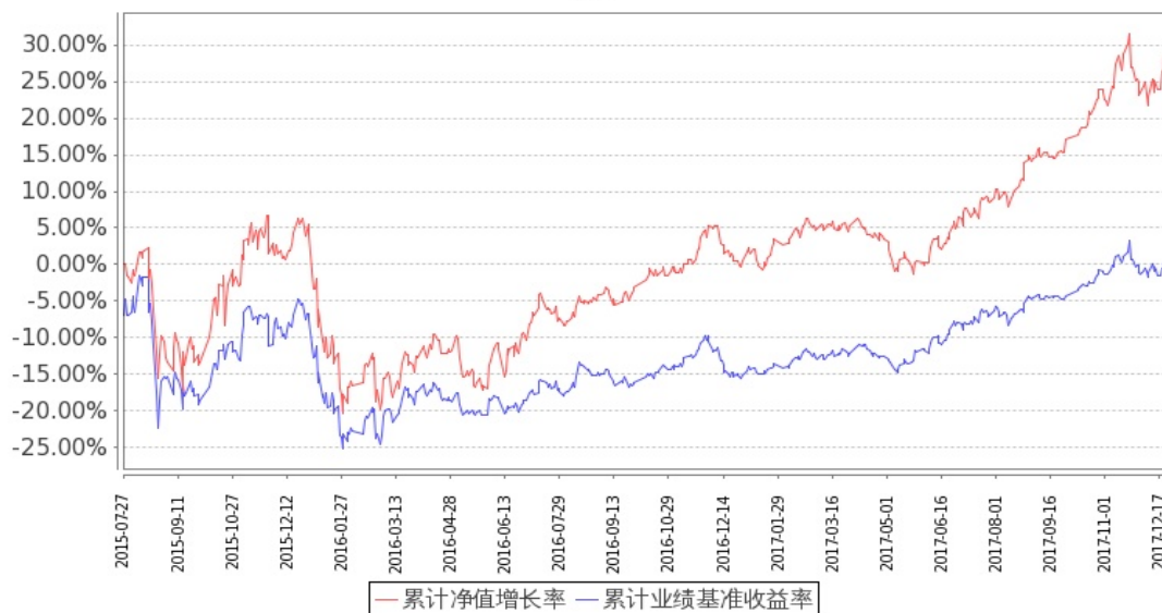
图：嘉实低价策略股票基金份额累计净值增长率与同期业绩比较基准收益率的历史走势对比图 (2015 年 7 月 27 日至 2017 年 12 月 31 日)

注：按基金合同和招募说明书的约定，本基金自基金合同生效日起 6 个月内为建仓期，建仓期结束时本基金的各项投资比例符合基金合同（十二（二）投资范围和（四）投资限制）的有关约定。