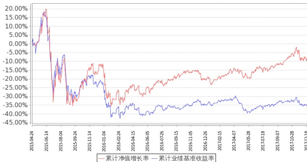
图：嘉实先进制造股票基金份额累计净值增长率与同期业绩比较基准收益率的历史走势对比图 (2015 年 4 月 24 日至 2017 年 12 月 31 日)

注：按基金合同和招募说明书的约定，本基金自基金合同生效日起 6 个月内为建仓期，建仓期结束时本基金的各项投资比例符合基金合同（十二（二）投资范围和（四）投资限制）的有关约定。