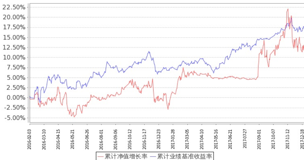
图：嘉实创新成长混合基金累计份额净值增长率与同期业绩比较基准收益率的历史走势对比图 (2016年2月3日至2017年12月31日)

注：按基金合同和招募说明书的约定，本基金自基金合同生效日起6个月内为建仓期，建仓期结束时本基金的各项投资比例符合基金合同（十二（二）投资范围和（四）投资限制）的有关约定。