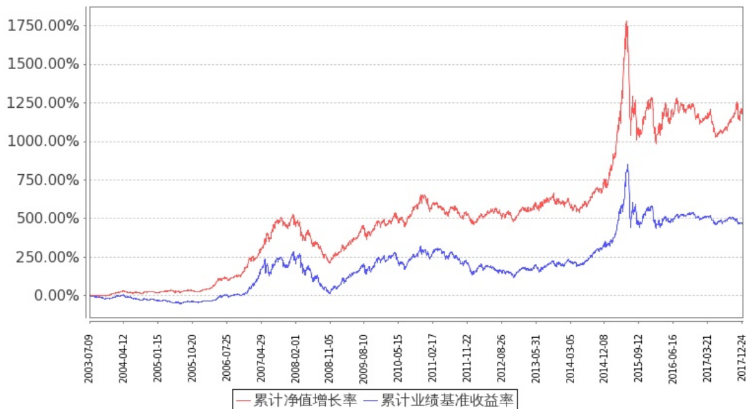
图：嘉实增长混合份额累计净值增长率与同期业绩比较基准收益率的历史走势对比图