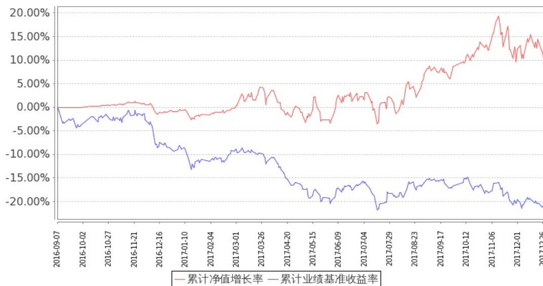
图 1：嘉实文体娱乐股票 A 基金累计份额净值增长率与同期业绩比较基准收益率的历史走势对比图