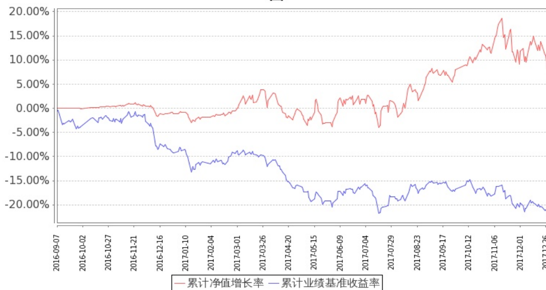
图 2: 嘉实文体娱乐股票 C 基金累计份额净值增长率与同期业绩比较基准收益率的历史走势对比图