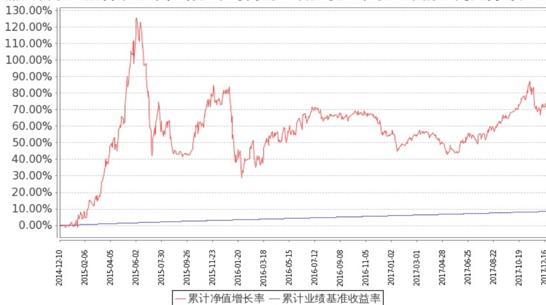
图：嘉实新收益混合基金份额累计净值增长率与同期业绩比较基准收益率的历史走势对比图 (2014 年 12 月 10 日至 2017 年 12 月 31 日)

注：按基金合同和招募说明书的约定，本基金自基金合同生效日起 6 个月内为建仓期，建仓期结束时本基金的各项投资比例符合基金合同（十二（二）投资范围和（四）投资限制）的有关约定。