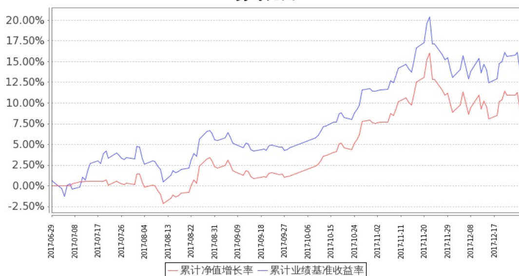
图：嘉实富时中国 A50ETF 联接基金份额累计净值增长率与同期业绩比较基准收益率的历史走势对比图

嘉实富时中国 A50ETF 联接累计净值增长率与同期业绩比较基准收益率的历史走势对比图